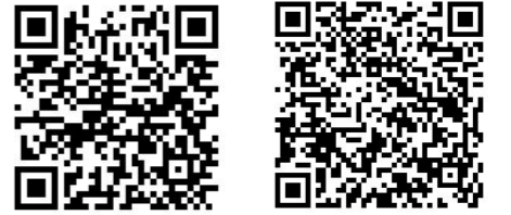
經濟不利學生安心就學獎補助細則 11301 經濟不利學生安心就學獎補助線上表單